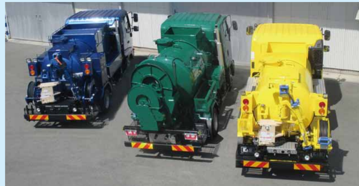
K&E本社工場に、様々な水量・水圧の高圧洗浄車が集合しました。