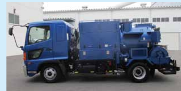
JS-04SS2270A 【高圧時】水量217L/min 水圧:20MPa 【超高圧時】水量58L/min 水圧:68MPa