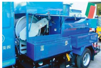
メインリール 自動巻き送り式