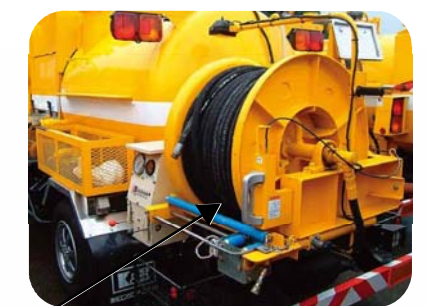
※後ろリールタイプも有り

※2段切換型洗浄車や後部リール車も取り揃えております。また、2～3トン車の洗浄車も架装しております。