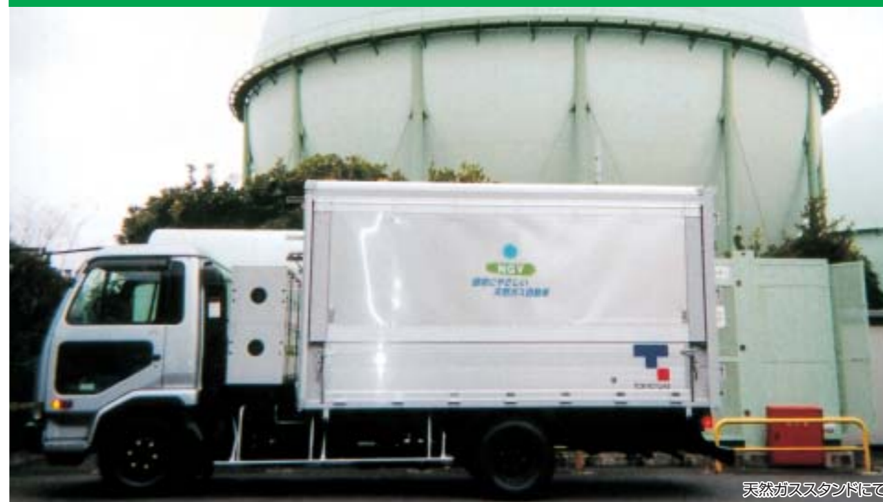
天然ガススタンドにて

CNGを燃料とする車両より、P.T.O駆動にて圧縮ポンプを作動させCNG供給スタンドに設けられたディスペンサーを介し燃料供給をする車両です。