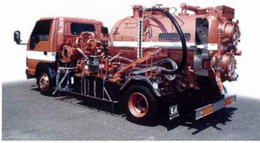
グリストラップ汚泥減容車 TM-03DSP

飲食店などの厨房排水に多量に含まれる油脂分を回収するために法律で設置が義務付けられているグリストラップ。しかし飲食店業界ではグリストラップの閉塞（詰まり）に苦慮しているのが現状です。そこで考案されたのが当該機種です。特徴はグリストラップ汚泥を吸引・回収した後、汚泥に薬品を添加・攪拌することにより固体・液体の分離を行い、分離した水を排水することで、回収物の減容化を図ります。