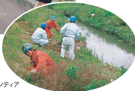
リバーサイドボランティア

環境整備機器メーカーである当社は、清掃活動を通じて地域環境の保全にも努めています。本社（高知市布師田）は高知県よりロードボランティアの、明見工場・技術センター（南国市明見）は南国市よりリバーサイドボランティアの認定を受け、定期的に会社周辺の道路や河川の清掃活動を実施しています。