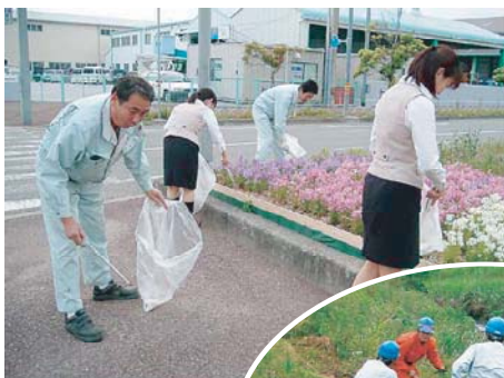
ロードボランティア