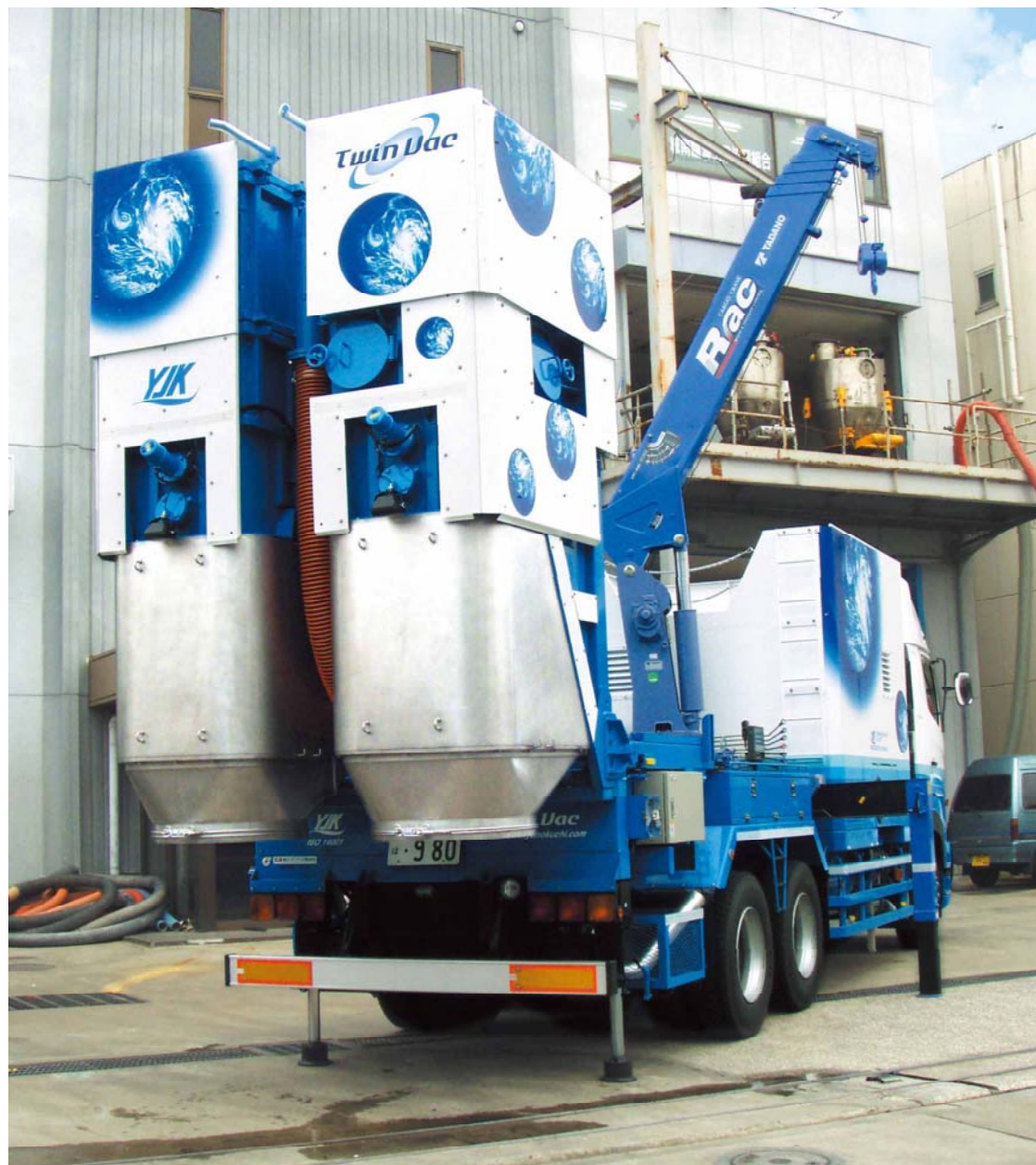
袋詰め作業はこの状態でいきます。

粉体の周囲を飛散させることなく、ほぼ100%の回収率を実現し、機能面・環境面のいずれにおいても優れた性能を誇っています。クレーンも装備し、袋詰めした回収物もトラックに積み込み可能となっています。