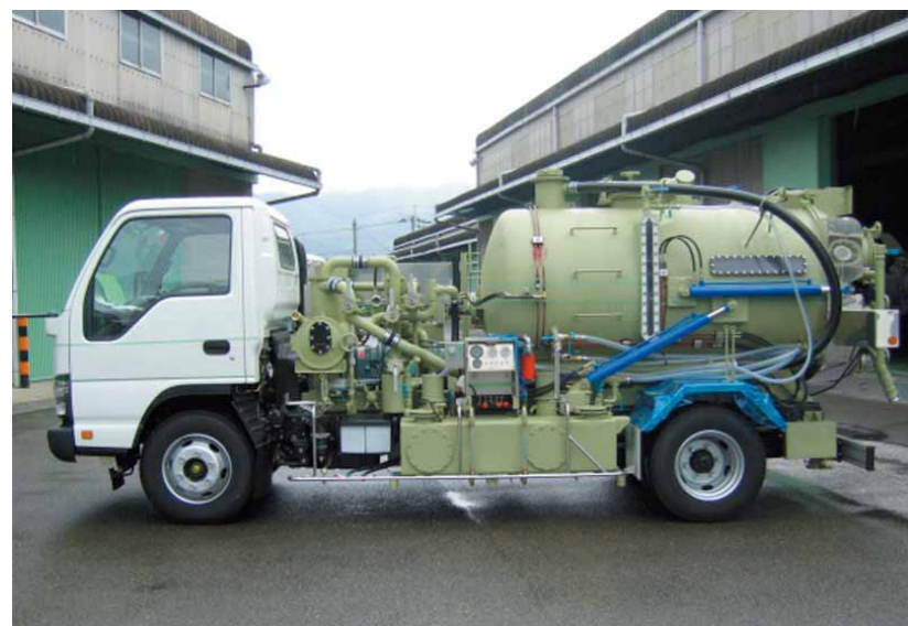
グリーストラップ減容車 RTM-03BVP