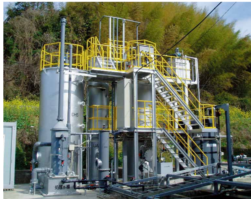
有機性廃水処理プラント

SWATシステムは、廃水を収集するグリーストラップ減容車とそれを浄化する定置型プラントで構成されます。減容車のタンクに吸引された廃水に凝集剤を入れ、油分やSS分を固形化して除去します。残りの液体をこの有機性廃水処理プラントに入れ、嫌気性菌 (UASB法) と、好気性菌 (DHS法) の二つの生物反応器を通し、下水に放流できる水準にまでします。