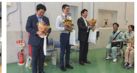
高知での施工展開催の準備・運営にご尽力された管路協中四国支部の幹部の皆様