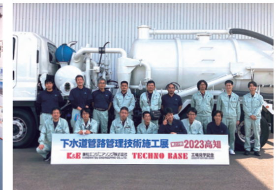
下水道管路管理技術施工展 2023高知 K&E 高知支店 高知工場 高知営業部