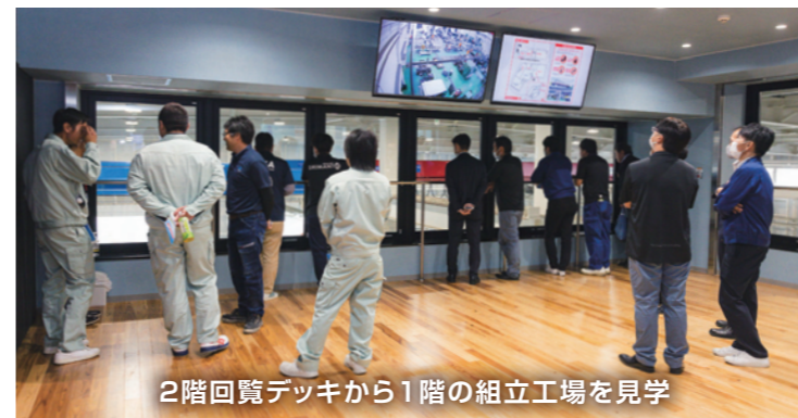
2階回覧デッキから1階の組立工場を見学