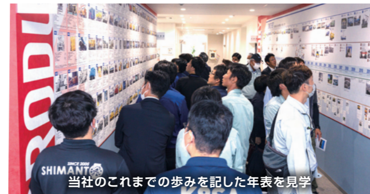
当社のこれまでの歩みを記した年表を見学