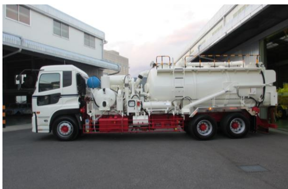
■システム図（乾式ルーツブロワー搭載車）